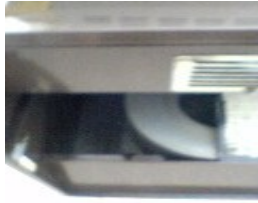
① フィルター取外し