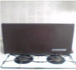
④ レンジフードカバー取外し