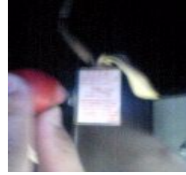
③ レンジフード配線