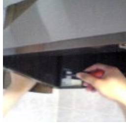
② レンジフードカバーボルト