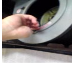
⑥ ベルマウスボルト